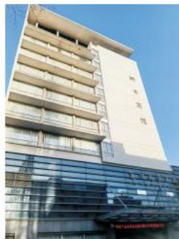
复旦大学卿云宾馆