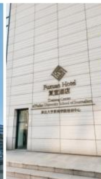
复旦大学复宣酒店