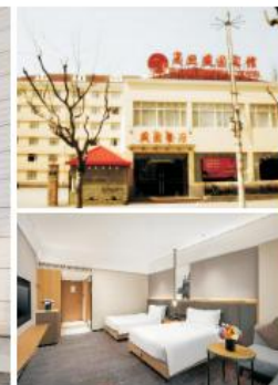
复旦大学燕园宾馆