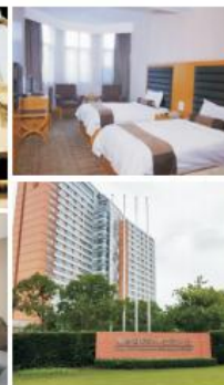
复旦国际学术交流中心