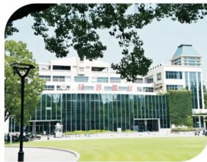
复旦大学食堂：旦苑餐厅